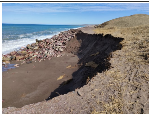
Gros effondrement aval