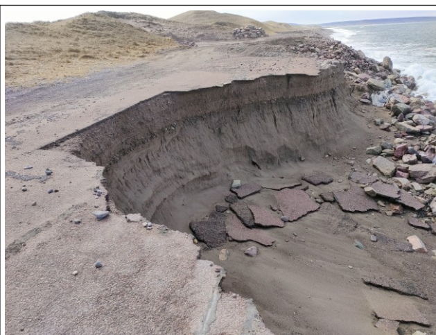
Vue de la chaussée du même effondrement