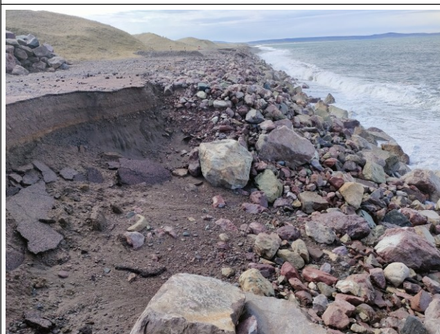
Evolution de l'effondrement sur la plateforme