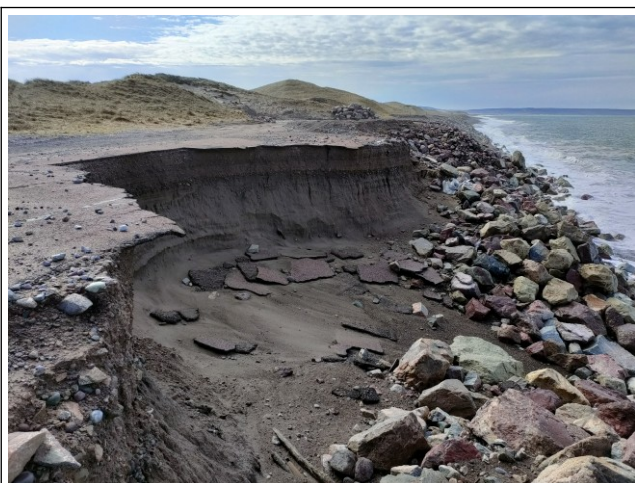
Effondrement entre la digue et la plateforme

- Sans évolution significative depuis Lundi.